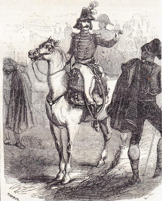
Murat apaisant une insurrection à Madrid. Page 125.

« J'ai reçu votre lettre de Baylen. D'après le mouvement de l'ennemi, le général Dufour a très-bien fait de gagner de vitesse sur la